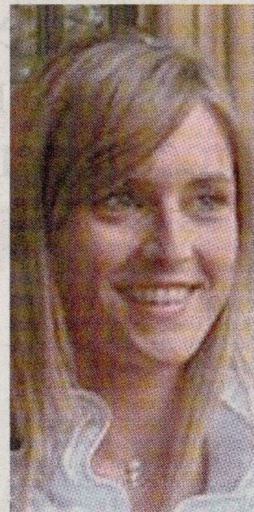
SORRIDENTE Famose le pubblicità in cui mangiava biscotti di una nota marca